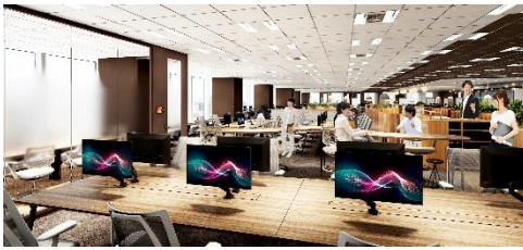
ワークエリア（フリーアドレス型）