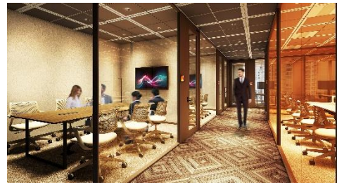
ゲストエリア（会議室コーナー）