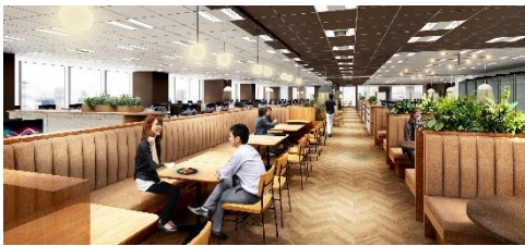
オープンコミュニケーションエリア