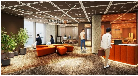
レセプション（受付）