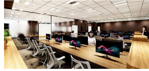
ワークエリア（プロジェクト型）